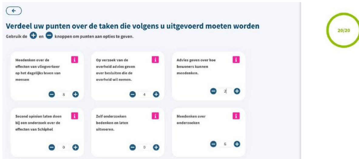
Figuur 2-2: voorbeeld van de start van de PWE keuzetaak over de Maatschappelijke Raad Schiphol; Experiment 2

Hieronder geven wij een overzicht van de taken waar deelnemers tussen konden kiezen bij de Omgevingshuis keuzetaak in de PWE. In de linker kolom staat de taak, in de middelste kolom hoe de taak is beschreven in de PWE-keuzetaak en in de rechterkolom staat hoeveel inspanning de taak kost. Omdat er onzekerheid is presenteren we voor de intensiteit zowel de ondergrens als de bovengrens die we aan deelnemers hebben getoond.